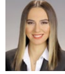
Göçke Karakaya Gül Hukuk - 2005 Türkiye Vakıflar Bankası T.A.O., Hukuk Danışman Yardımcısı